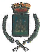
Comune di Castellana Grotte