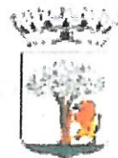
Comune di Noci