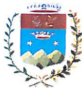
Comune di Putignano